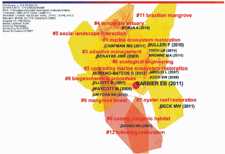
注:节点大小与文献的共被引频率成正比;深黑色圈层表示节点具有突现性。CiteSpace 设置: Node Types: Cited Reference; Selection Criteria: Top10%; 其他采用默认设置。

研究领域可以定义为从知识基础到研究前沿的时间映射。原始数据中的参考文献(即共被引参考文献)组成了该研究领域的知识基础,而相应的引文(原始数据)就形成了研究前沿 [5] 。对原始数据的文献共被引网络进行聚类,可进一步得到细分的研究主题。导入 866 篇文献,共计 43 237 篇被引参考文献,对其进行聚类,并基于对数似然率算法(LLR)对 12 个聚类群组进行命名,得到文献共被引网络图谱(图 3)。图谱中包含了 806 个节点和 1 776 条连线。每个节点表示一篇文献,连线表示两篇论文之间的共被引关系,节点大小表示节点文献的共被引频率。