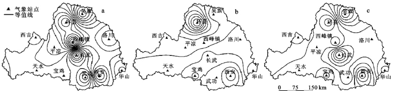
图 2 渭河流域年均温的第一特征向量场(a)、第二特征向量场(b)及第三特征向量场(c)

域一致变热或变凉是季风区气温异常最常出现的情况。图 2b 是第二特征向量场,可较好地反映出流域年平均气温变化的南北差异。零等值线基本上沿平凉、西峰镇走向分布,表明年平均气温可能以此为界具有南、北相反的变化特征。图 2c 给出了流域年平均气温经 EOF 分解后的第三特征向量场,表现了年平均气温的东西向分布差异。