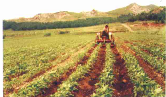
附图14 作业中的1QD-3型垄向区田筑挡机