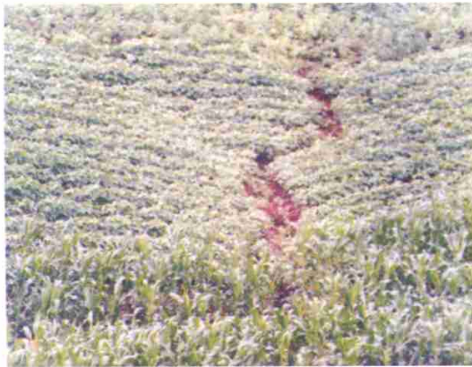
附图11 刚开始形成断垄的横坡垄