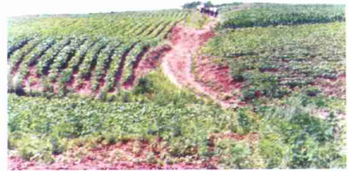
附图12 断垄处最初为羊肠小道，继而成为田道路