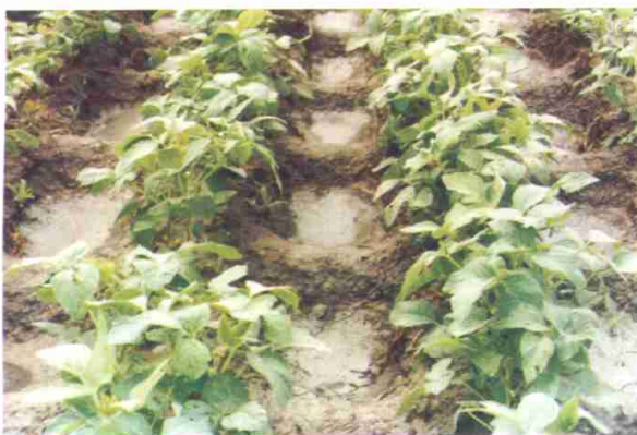
附图13 垄向区田拦蓄降雨情况