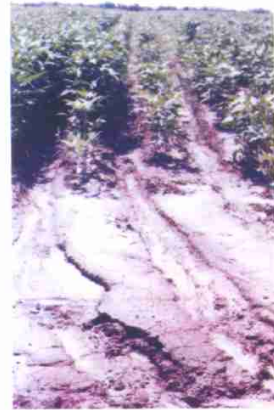
附图10 坡脚流出的雨水