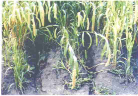
附图9 垄沟的细沟侵蚀