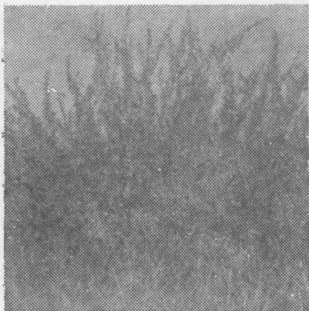
半干旱地区发展柠条可促进 水分利用, 柠条长势良好