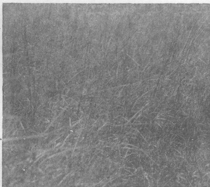
草地施肥提高了水分提用, 增加生物量