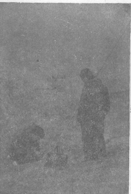
科研人员野外测定土壤含水量 (测深 5m)