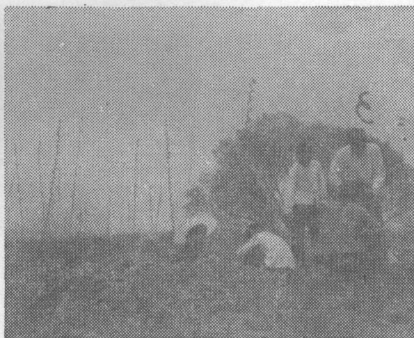
科研人员野外观测土壤剖面 and 采集土样